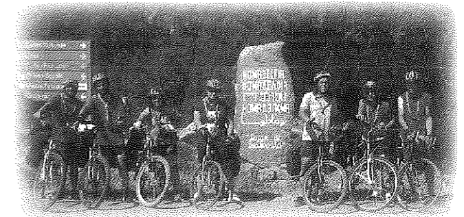
Il Clan alle porte di Nomadelfia