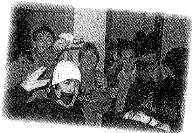
Il Canto della Stella, ha visto impegnati scout e adolescenti del quartiere per due serate a portare gli auguri del Buon Natale a tante famiglie.