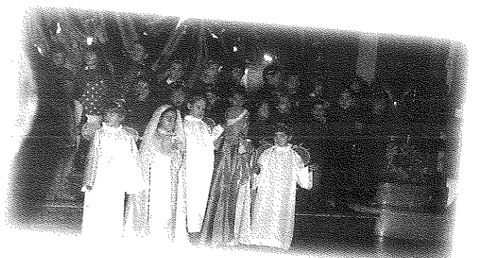
Il 16 dicembre i bambini della Scuola materna delle Suore Dimesse con le loro voci e la loro presenza hanno allietato la preparazione al Natale da vivere con gioia in famiglia.