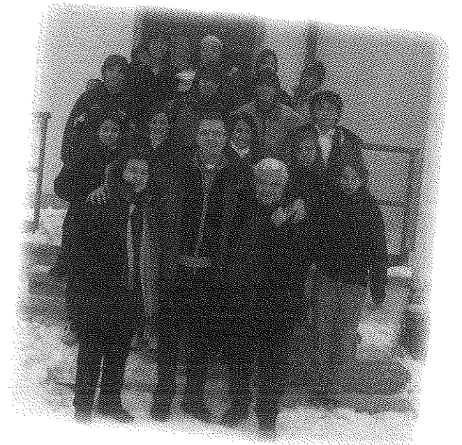
Il breve camposcuola con i ragazzi di terza media, è stato un bello stacco invernale che ha aiutato ad essere più uniti.