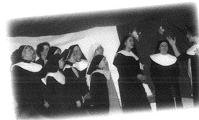
Il Gruppo Teatro Giovani della nostra parrocchia ha realizzato una Commedia brillante, tratta dal film "Sister Act", nel pomeriggio del 26 dicembre, ottenendo un caloroso applauso per la bravura dimostrata dagli attori.