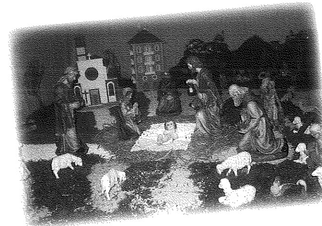
In parrocchia è stato allestito un bellissimo presepe. Nel caratteristico paesaggio con la Sacra Famiglia sono stati inseriti i modellini della nostra chiesa parrocchiale e di un palazzo moderno per indicare che Gesù è al centro di tutti i tempi e di tutte le nostre strade: noi andiamo a Lui e Lui viene a noi perché ci sia un Incontro.