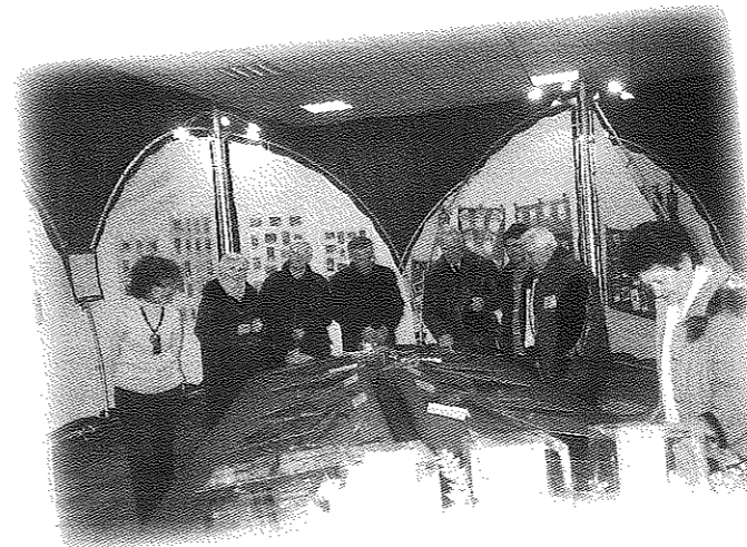
Nel Salone del Centro d'Incontro di Via Trapani, c'è stata la bella Mostra del "Natale in cartolina". Sono state esposte cartoline e biglietti augurali di varie nazioni e di vari tempi sul tema del Natale. Accanto, una serie di "Santini", presepi dei bambini, lavori delle scuole.

Vogliamo così creare occasione per dare valore all'organo restaurato, per accogliere le capacità musicali di persone del nostro quartiere, per trascorrere una serata insieme tra amici con la buona musica.