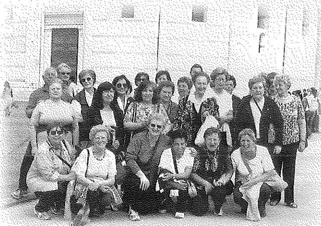
Nella foto: il gruppo partecipante alla Gita del 25 aprile 2007 a Pisa in Piazza dei Miracoli con il Circolo Albino Franchini