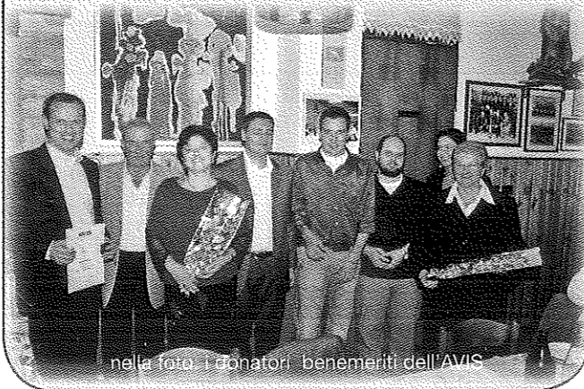
nella foto: i donatori benemeriti dell'AVIS

La Sezione AVIS di Borgonuovo-Chievo ha festeggiato i donatori benemeriti del gruppo, domenica 14 ottobre 2007. Insieme a tutti i soci si è trascorsa una giornata in serena amicizia, nella consapevolezza e nell'impegno che la donazione del sangue è importante e vitale per le persone ammalate. Si rinnova l'invito a diventare donatori di sangue. Basta poco per aiutare molto!