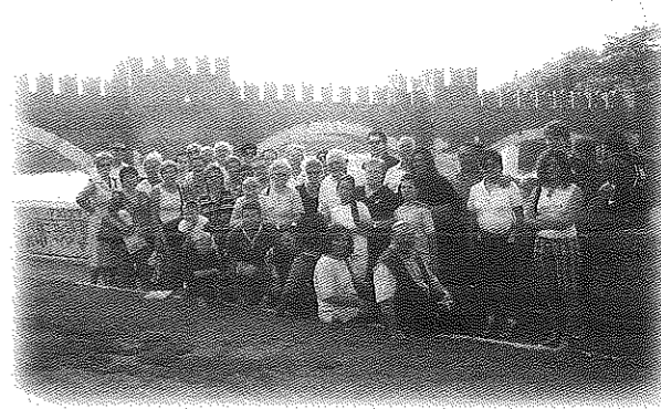
Il gruppo che ha partecipato alla visita "Verona al tempo degli Scaligeri", effettuata nel pomeriggio di domenica 3 settembre, con l'aiuto di una guida del Centro Turistico Giovanile.

Nel salone parrocchiale dalle ore 15.30 si potrà rinnovare la propria tessera oppure iscriversi per la prima volta, e sarà l'occasione per stare insieme e conoscersi.