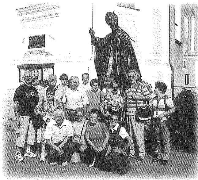
Dall'11 al 16 settembre 2006, gli alpini hanno fatto la loro annuale gita, andando a visitare le città di Praga e di Cracovia, fermandosi con commozione al campo di concentramento di Auschwitz, e poi in un pellegrinaggio di fede alla Madonna di Jasna Gora a Czestochowa e nella città di papa Giovanni Paolo II. Giornate di sereno e gioioso stare insieme, di visita a città d'arte, di espressione di fede. Un grazie agli alpini che hanno organizzato questa bella gita.