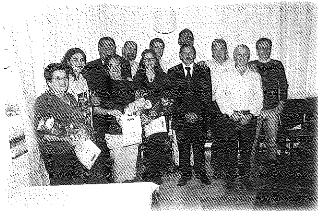
Durante la Festa dell'AVIS, sezione di Borgonuovo - Chievo, di domenica 15 ottobre 2006, questi donatori di sangue, hanno ricevuto un riconoscimento per le donazioni fatte.