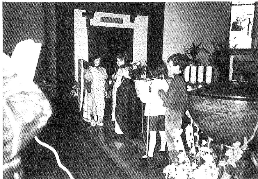
I bambini di quarta elementare ripresi durante la drammatizzazione «Il Padre Misericordioso»

Parola: la Parola dà la risposta a tutti i perché, ci fa conoscere un Dio che non ci abbandona mai.