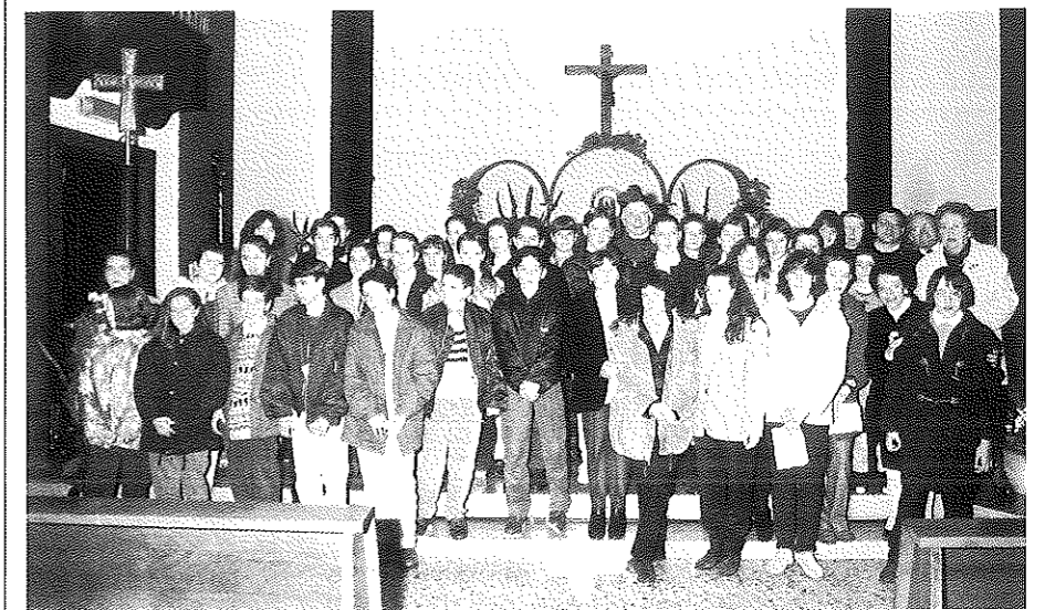
I 39 ragazzi che domenica 14 novembre 1993 hanno ricevuto dalle mani del Vescovo Mons. Giuseppe Amari il