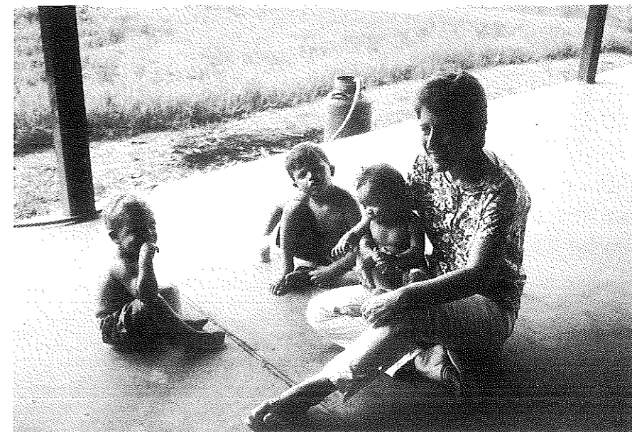
Santa Luzia do Parà - 14 gennaio 1993